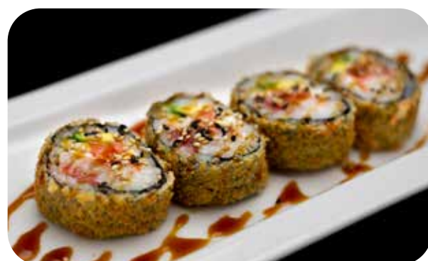
202 Fotomaki fritto futomaki mix frito € 7.00 🌿 🍷 🥛 🐟 🐠