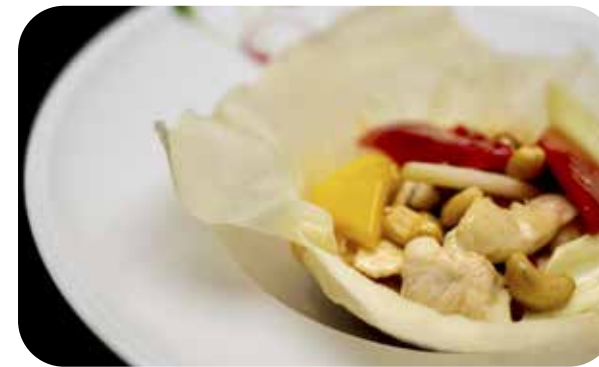
094 Pollo* con anacardi € 7.00 🌱