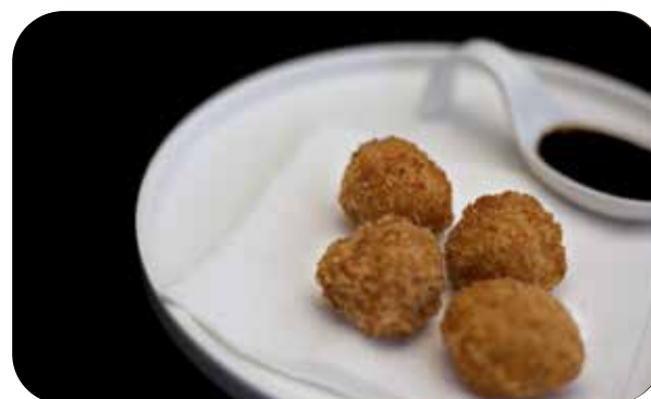
007 Puripuri ebi polpetta di gamberi* € 7.00 🌿 🍷